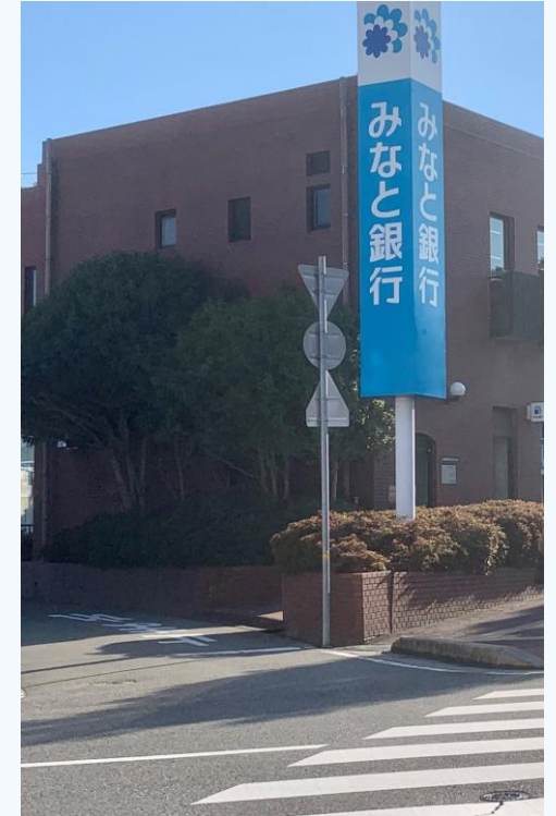
みなと銀行 志染支店