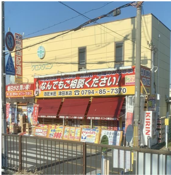
津田本店(酒屋さん)