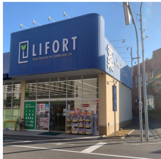
ライフオート志染店