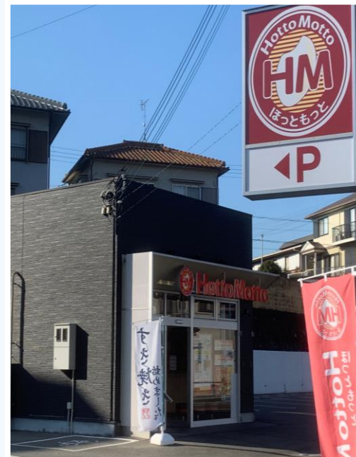
ほっともっと 三木志染町店