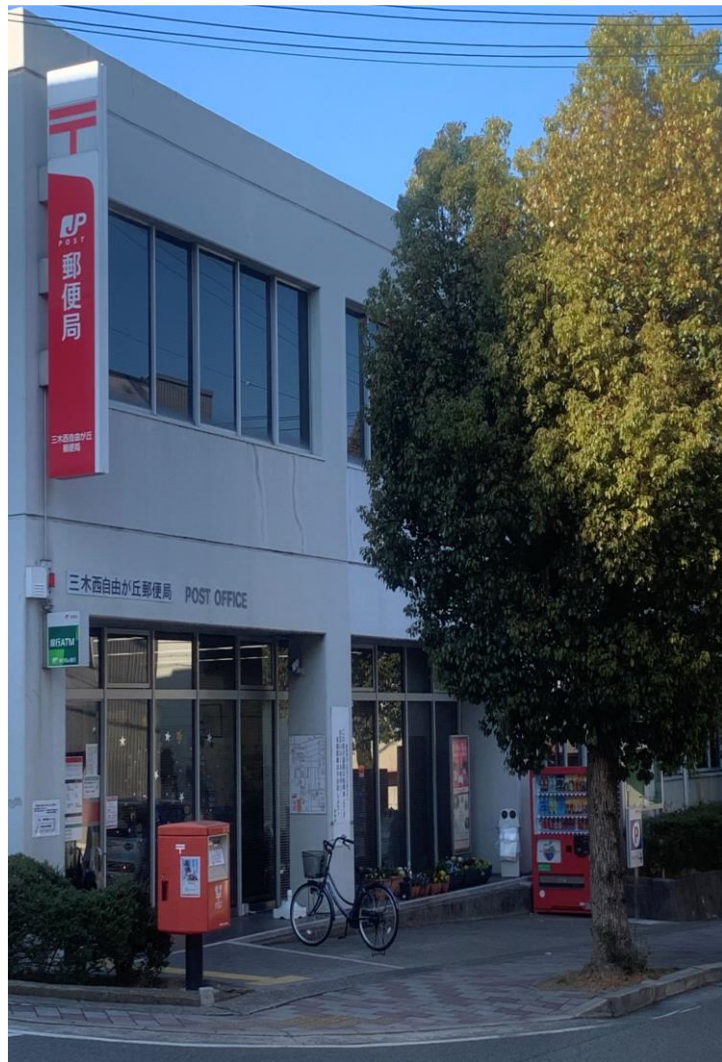
三木西自由が丘郵便局