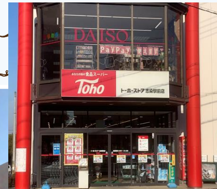
トーホーストア 志染駅前店