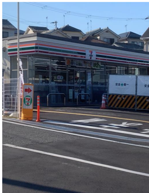
セブンイレブン 三木中自由が丘店